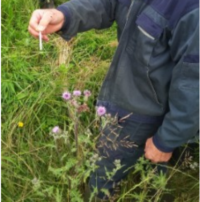
Figur 1 test af nitratmåleudstyr i dræn hos landmand Rasmus Rasmussen ved Odder.

Formålet med feltforsøget var at afdække anvendeligheden af måleudstyret for både landmænd og konsulenter i forhold til brugbarheden, nøjagtigheden og pålideligheden.