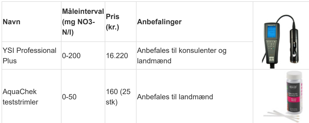
Tabel 1 Måleinstrumenterne, som er testet under feltforhold er beskrevet i tabellen

Det testede måleudstyr har den fordel, at målinger af nitratkoncentrationer i drænvand og vandløbsvand kan aflæses med det samme. På den måde er der potentiale i at anvende måleudstyret i forbindelse med screening af potentielt egnede placeringsmuligheder for minivådområder og andre drænvirkemidler forud for en dyberegående analyse. Ikke mindst er det i den forbindelse en stor fordel, at det er muligt at få en dialog mellem de berørte aktører, mens man går i marken.